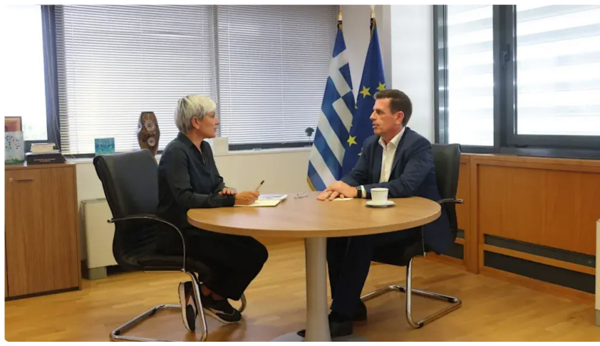
Με τον νέο Υπουργό Ναυτιλίας και Νησιωτικής Πολιτικής, κ. Χρήστο Στυλιανίδη