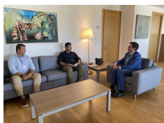
Συνάντηση με αντιπροσωπεία της Πανελλήνιας Ομοσπονδίας Συνοριακών Φυλάκων