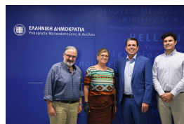
Με αντιπροσωπεία των Γιατρών του Κόσμου