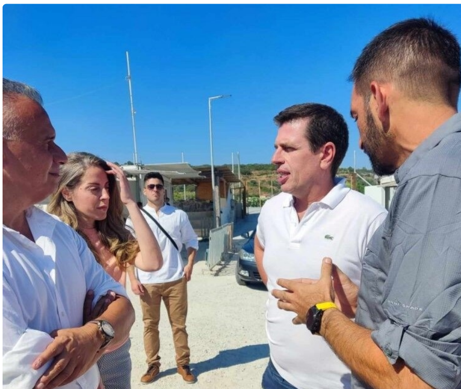
Επίσκεψη σε ΒΙΑΛ, Υπηρεσία Ασύλου και ΚΦΑΑ στη Χίο