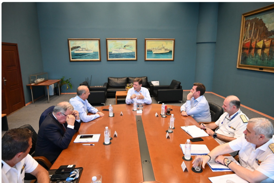
Επίσκεψη στο ΚΕΔ Λέσβου

Συνάντηση για το Μεταναστευτικό με τον Υπουργό Ναυτιλίας και Νησιωτικής Πολιτικής, κ. Μιλτιάδη Βαρβιτσιώτη, τον Υπουργό Προστασίας του Πολίτη, κ. Γιάννη Οικονόμου και την ηγεσία του Λιμενικού