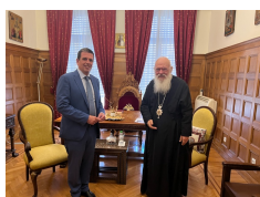
Με τον Μακαριώτατο Αρχιεπίσκοπο Αθηνών και πάσης Ελλάδος, κ.